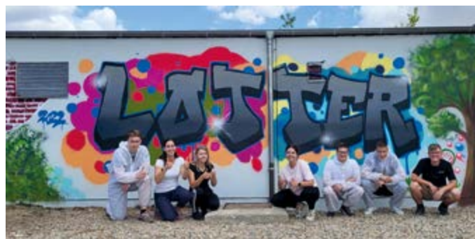
Die Ausbildung bei Lotter beginnt im August immer mit einer besonderen Woche – und besonderen Aktionen – zum Beispiel auch mal mit einem Graffitiworkshop in der Zweigniederlassung Oschatz.

Ansprechpartnerin Madeleine Liebetrau steht unter Telefon 03433 250-102 für auftretende Fragen gern bereit.